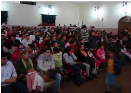
Conferencia con los padres de familia sobre “integración familiar”