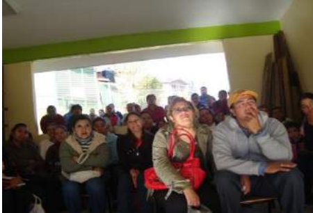
Conferencia con padres de familia sobre “Salud emocional”