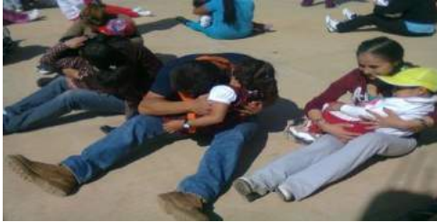
Taller sobre la “salud emocional”

A continuación se muestran algunas de las imágenes recaudadas durante el desarrollo del taller sobre “salud emocional”