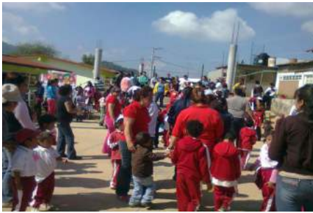
Terapia de constelación familiar