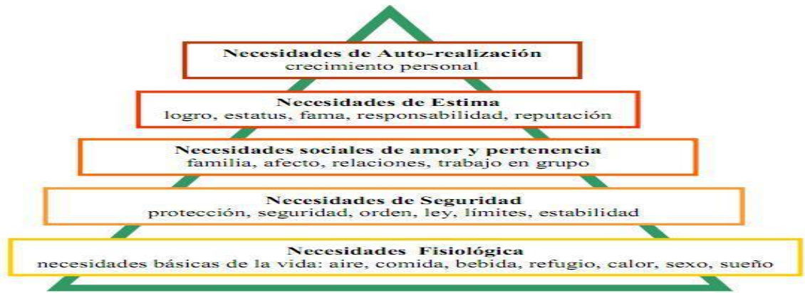
Figura 1. Adaptado de Chapman (2007).

La ilustración que se presenta en la parte superior, es una representación de las necesidades de los seres vivos en la cual se proponen desde la base; referente a lo fisiológico pasando por etapas en las que se cubren otros de los elementos que se requieren en la vida, hasta llegar a lo que es la cúspide que representa la autorrealización del sujeto. Todo esto requiere de una motivación en el sujeto.